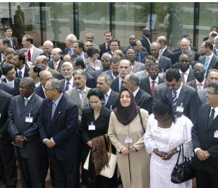
Delegados del XV Congreso de la Organización Meteorológica Mundial, Ginebra, mayo del 2.007.