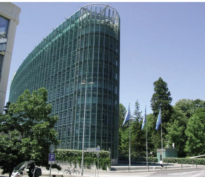
Edificio sede de la Organización Meteorológica Mundial en Ginebra.

de Meteorología, confirma esa inevitable vocación internacional definiendo entre sus competencias y funciones la representación del Estado en los organismos internacionales de carácter meteorológico y en las estructuras de cooperación “cuyos miembros sean Servicios Meteorológicos Nacionales”. Le atribuye en particular la función de asegurar el cumplimiento de los compromisos de España que se deriven de los programas de la OMM, “especialmente en lo referente al intercambio internacional de datos y productos”. Además le confiere la responsabilidad de contribuir a la “planificación y ejecución de la política del Estado en materia de cooperación internacional al desarrollo en materia de meteorología y climatología”. Es indudable que la cooperación internacional en meteorología y climatología, además de su crítica necesidad, sirve a todos los países para beneficiarse de iniciativas de carácter global y de proyectos desarrollados en ámbitos muy diversos. Pero el viejo