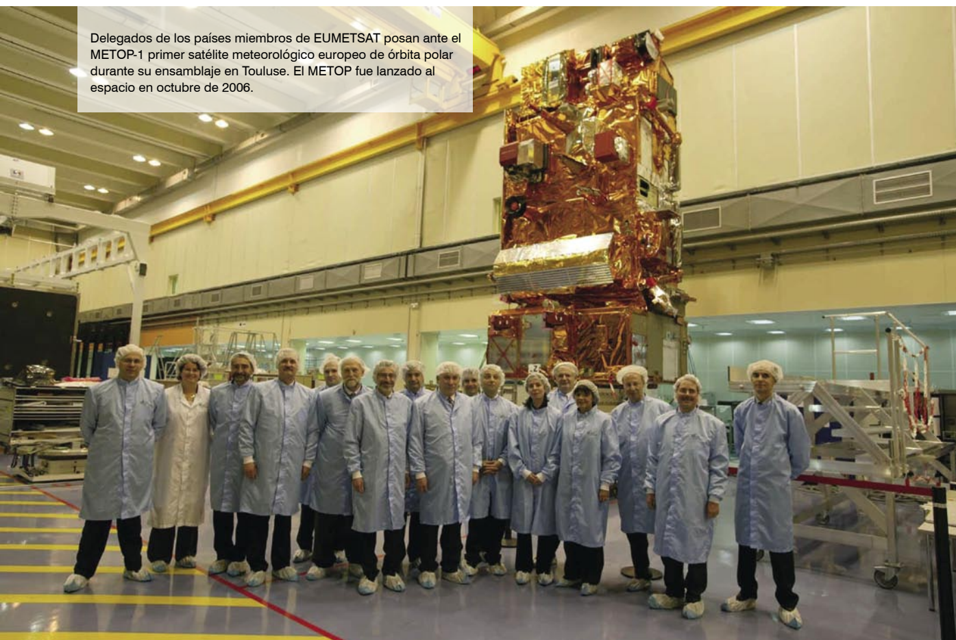
Delegados de los países miembros de EUMETSAT posan ante el METOP-1 primer satélite meteorológico europeo de órbita polar durante su ensamblaje en Toulouse. El METOP fue lanzado al espacio en octubre de 2006.

de Meteorología, confirma esa inevitable vocación internacional definiendo entre sus competencias y funciones la representación del Estado en los organismos internacionales de carácter meteorológico y en las estructuras de cooperación “cuyos miembros sean Servicios Meteorológicos Nacionales”. Le atribuye en particular la función de asegurar el cumplimiento de los compromisos de España que se deriven de los programas de la OMM, “especialmente en lo referente al intercambio internacional de datos y productos”. Además le confiere la responsabilidad de contribuir a la “planificación y ejecución de la política del Estado en materia de cooperación internacional al desarrollo en materia de meteorología y climatología”. Es indudable que la cooperación internacional en meteorología y climatología, además de su crítica necesidad, sirve a todos los países para beneficiarse de iniciativas de carácter global y de proyectos desarrollados en ámbitos muy diversos. Pero el viejo