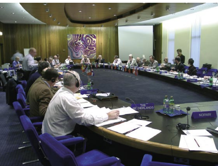
Reunión del Consejo del Centro Europeo de Predicción Meteorológica, integrado por los directores de 18 servicios Meteorológicos Nacionales europeos.

tarea científica para desarrollarlas. En vista de ello, los países de Europa occidental iniciaron una cooperación mucho más comprometida que la que ya mantenían dentro de la OMM, organismo no creado para emprender trabajos operativos. El primer resultado fue la creación en 1975 del Centro Europeo de Predicción Meteorológica a Plazo Medio que tiene su sede en Reading (Reino Unido) y más de treinta años después continúa siendo el líder mundial en modelización atmosférica. España es miembro desde su fundación y la Agencia Estatal de Meteorología, además de asumir la representación nacional, mantiene una estrecha cooperación con el Centro y utiliza sus productos para sus propias operaciones al igual que más de 20 Servicios europeos, muchas instituciones científicas y numerosos usuarios.