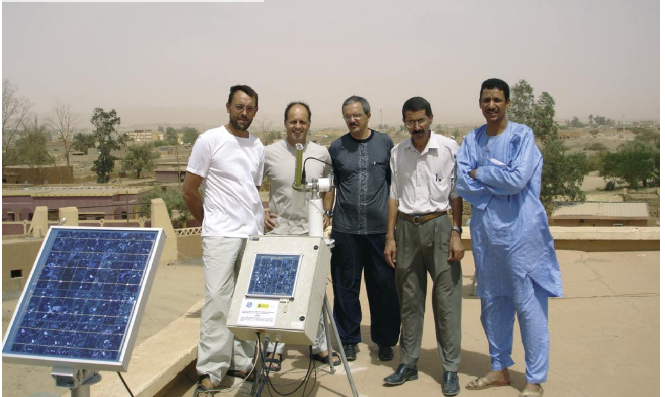
Instalación de un fotómetro solar en Tarramaset (Sahara) bajo cooperación de la Agencia Estatal de Meteorología con el servicio meteorológico de Argelia.