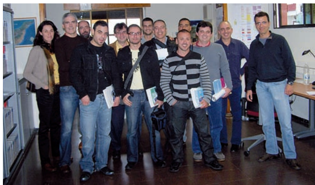
Los aficionados, entusiasmados durante la visita.