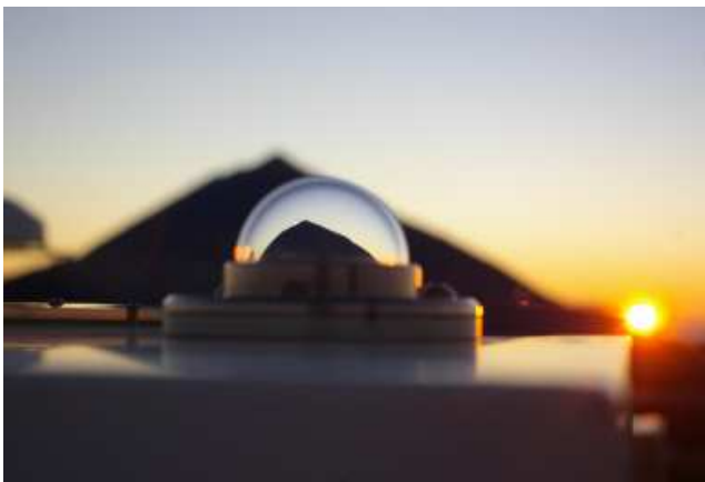
El Teide a través del domo del espectrofotómetro Brewer del Observatorio Atmosférico de Izaña.

Las actividades desarrolladas por Alberto Redondas durante su carrera profesional han propiciado que Izaña juegue un papel muy destacado en la observación de la capa de ozono y su control de calidad en el contexto internacional.